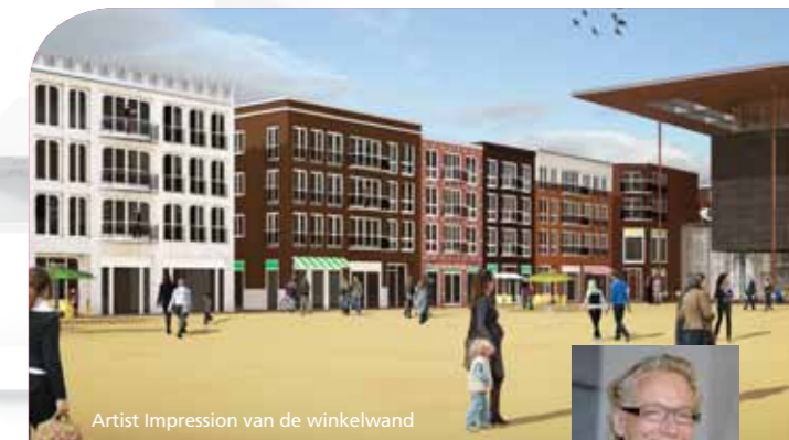
Artist Impression van de winkelwand

De noordkant van het Wilhelminaplein ondergaat de komende jaren een complete metamorfose. Maar hoe komt de pleinwand er uit te zien, hoeveel ruimte is er voor winkels en horeca en wie heeft de gebouwen ontworpen? We zoomen alvast in op het Wilhelminaplein in 2013.